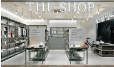
[THE SHOP] 東京都千代田区 JPタワー [KITTE] 4F