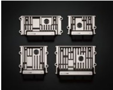
[デンソー / エンジンコントロールユニット]